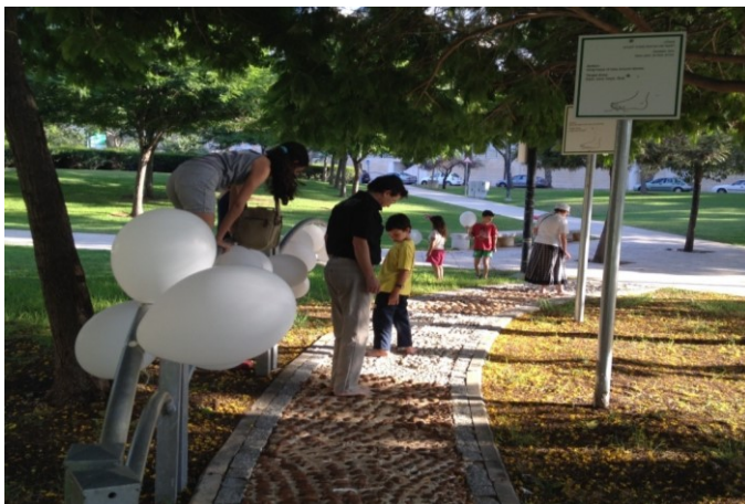
שביל רפלקסולוגי במודיעין

http://www.healthycities.co.il/siteFiles/13/94/10382.asp