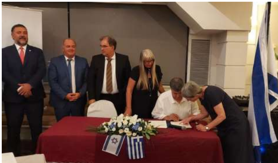
תהליך החתימה על מסמך ההסכמות

מפגש גומלין יתקיים בארץ במסגרת המוניאקספו של מרכז השלטון המקומי ב 6-8 בדצמבר.