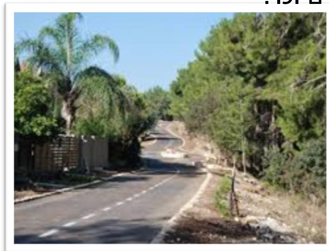
טיילת היער ביקנעם וקרבה למסלול נגיש לנכים